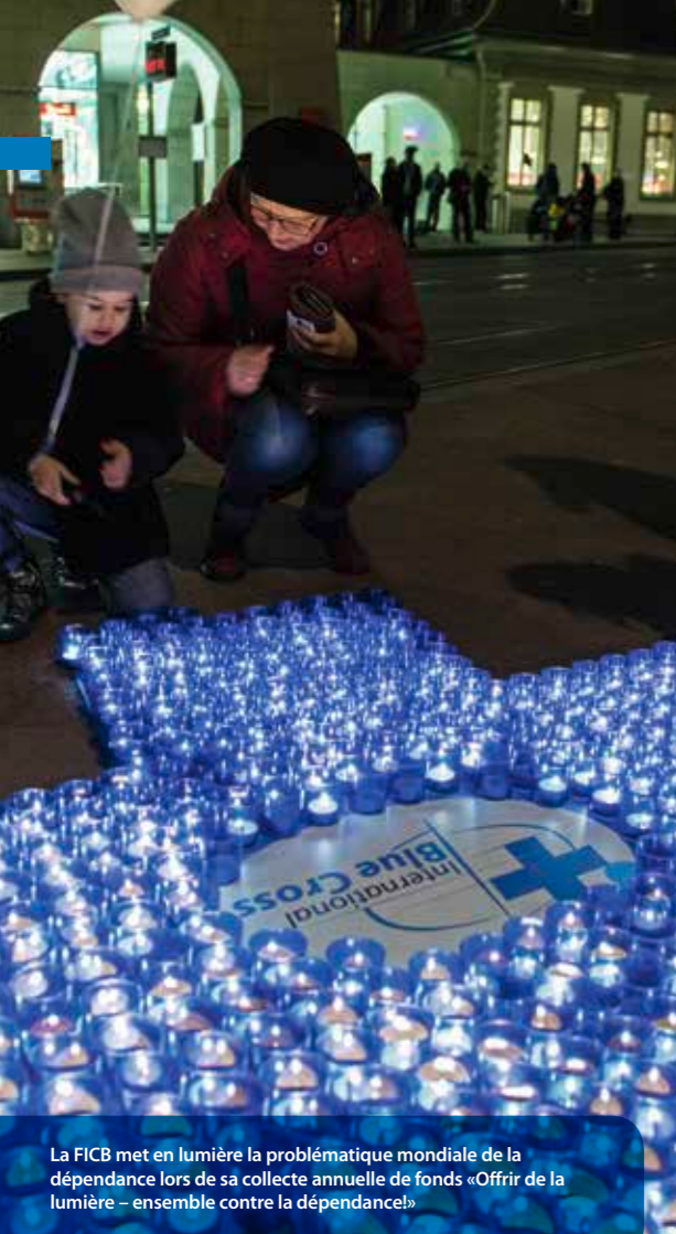
La FICB met en lumière la problématique mondiale de la dépendance lors de sa collecte annuelle de fonds «Offrir de la lumière – ensemble contre la dépendance!»