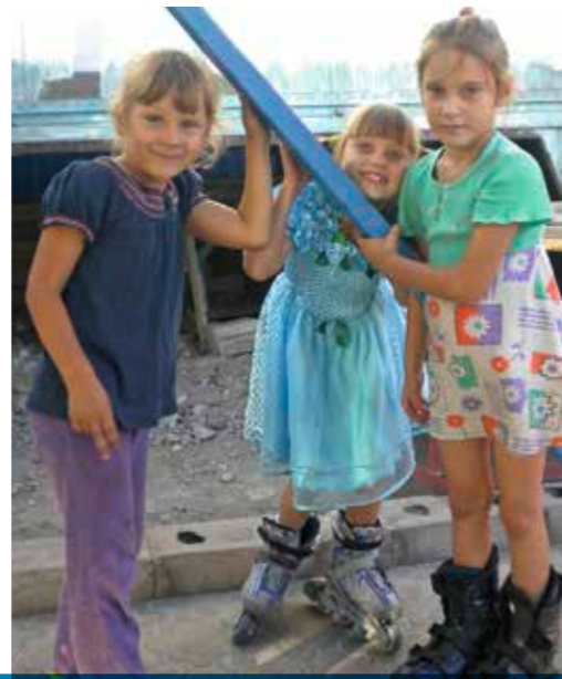
Des enfants jouent dans la cour de la Maison Gawan à Marioupol, Ukraine.

veillé sur nous!» Chaque soir, lorsque les grandes portes bleues se referment alors que les enfants retournent chez eux, l'espoir d'un lendemain demeure.