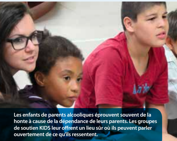
Les enfants de parents alcooliques éprouvent souvent de la honte à cause de la dépendance de leurs parents. Les groupes de soutien KIDS leur offrent un lieu sûr où ils peuvent parler ouvertement de ce qu'ils ressentent.