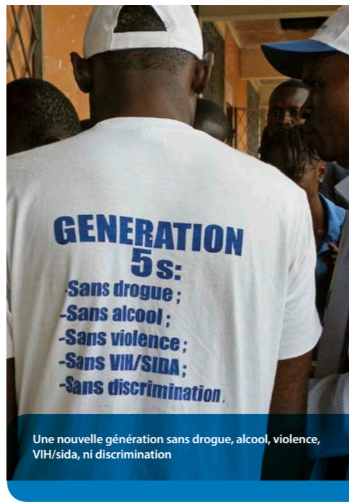
Une nouvelle génération sans drogue, alcool, violence, VIH/sida, ni discrimination

Selon une enquête interne menée par la Croix-Bleue congolaise (non publiée), 54% des adolescents âgés de 15 ans consomment régulièrement de l'alcool, les plus touchés étant ceux des quartiers défavorisés en périphérie de Brazzaville.