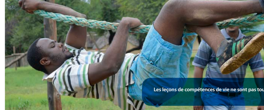
Les leçons de compétences de vie ne sont pas toujours faciles ...

Se basant sur l'analyse effectuée, la Croix-Bleue namibienne a décidé de mettre l'accent sur l'acquisition des compétences de vie dans la deuxième phase dudit projet.