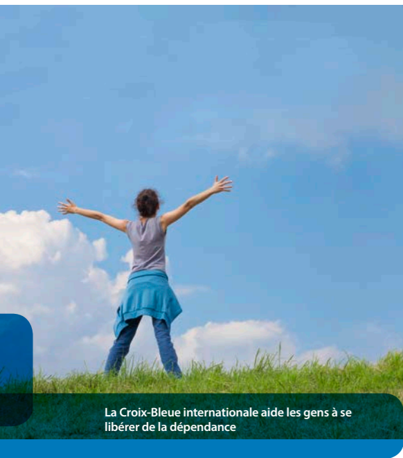
La Croix-Bleue internationale aide les gens à se libérer de la dépendance