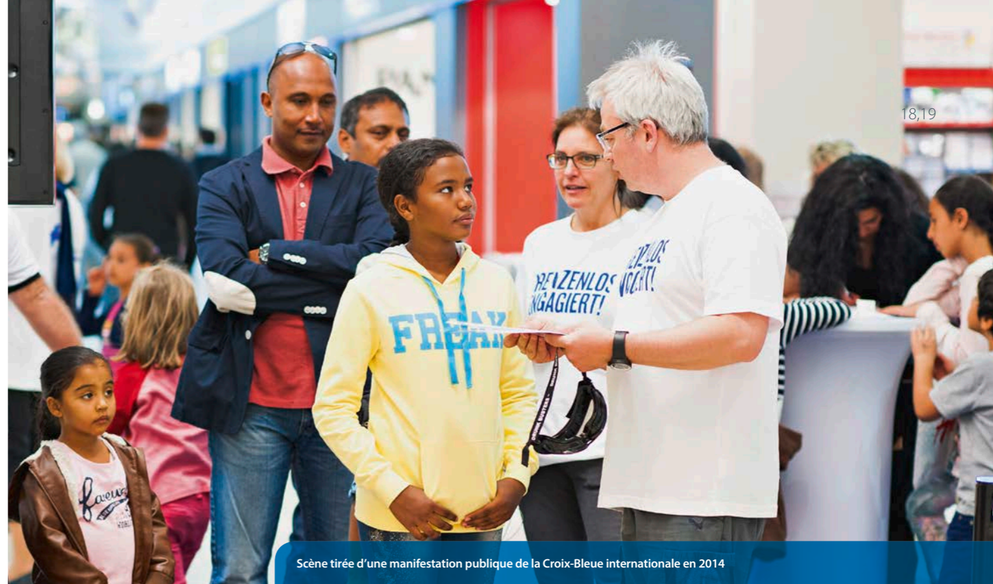
Scène tirée d'une manifestation publique de la Croix-Bleue internationale en 2014

Nous exprimons notre gratitude également à nos donateurs, partenaires et bénévoles pour leur générosité. Forts de leur soutien inlassable, nous nous engageons, avec un professionnalisme basé sur des normes d'excellence, à poursuivre la tâche qui est la nôtre au service de ceux qui sont dans le besoin partout dans le monde.