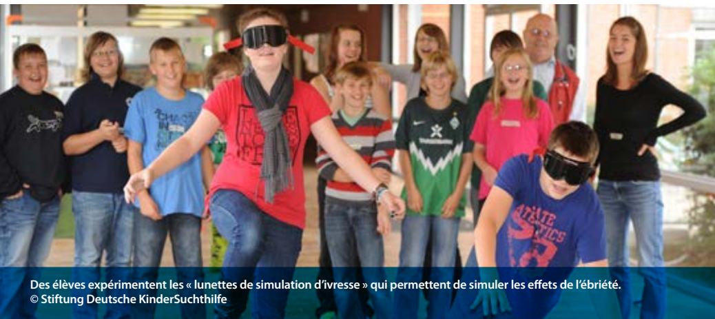
Des élèves expérimentent les «lunettes de simulation d'ivresse» qui permettent de simuler les effets de l'ébriété.

L'enseignement est un élément important de «blu:prEVENT», visant à informer de manière créative, interactive et stimulante. Ainsi, on propose aux élèves d'essayer des lunettes de simulation d'ivresse, qui simulent les symptômes qui apparaissent lorsque le taux