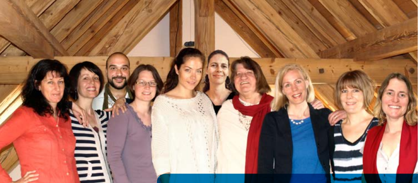
L'équipe du secrétariat de la Croix-Bleue internationale.