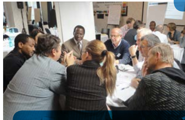
Lors de l'assemblée générale en Roumanie, les dirigeants des Croix-Bleue du monde entier se penchent sur les meilleures pratiques en matière de leadership.

Pour atteindre ces objectifs, les responsables de la FICB ont, lors de l'assemblée générale 2012, renouvelé leur engagement en faveur d'un leadership professionnel, transparent et basé sur les valeurs fondamentales de la Croix-Bleue: excellence, renforcement des capacités, respect, solidarité, intégration et spiritualité libératrice.