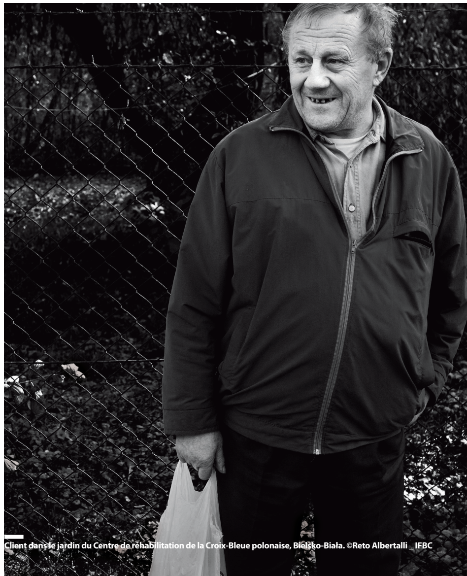
Client dans le jardin du Centre de réhabilitation de la Croix-Bleue polonaise, Bielsko-Biala.

La révision a été effectuée selon les normes suisses sur la révision restreinte, lesquelles prévoient que l'audit doit être mené de manière à détecter les principales anomalies comptables. Dans le cadre de son audit, BDO SA n'a pas relevé de faits, concernant la situation financière et le résultat, qui ne seraient pas conformes aux normes Swiss GAAP RPC ou qui enfreindraient la législation et/ou les statuts.