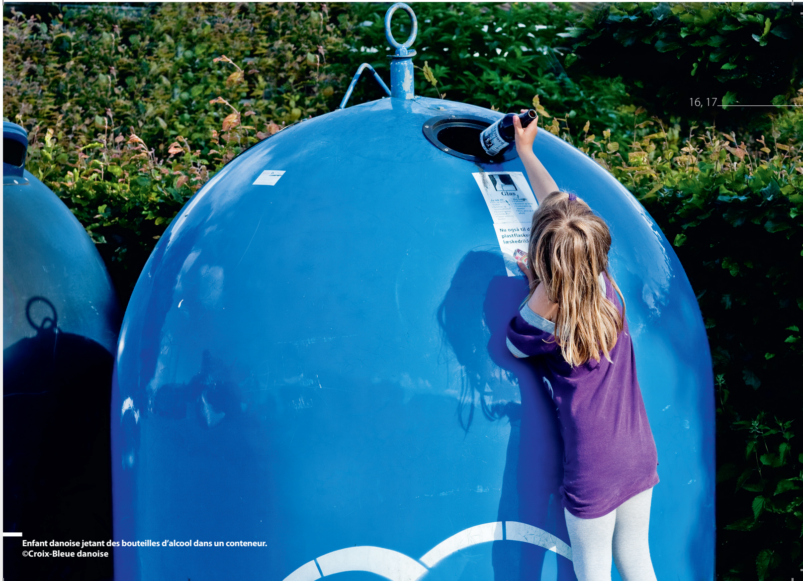
Enfant danoise jetant des bouteilles d'alcool dans un conteneur.