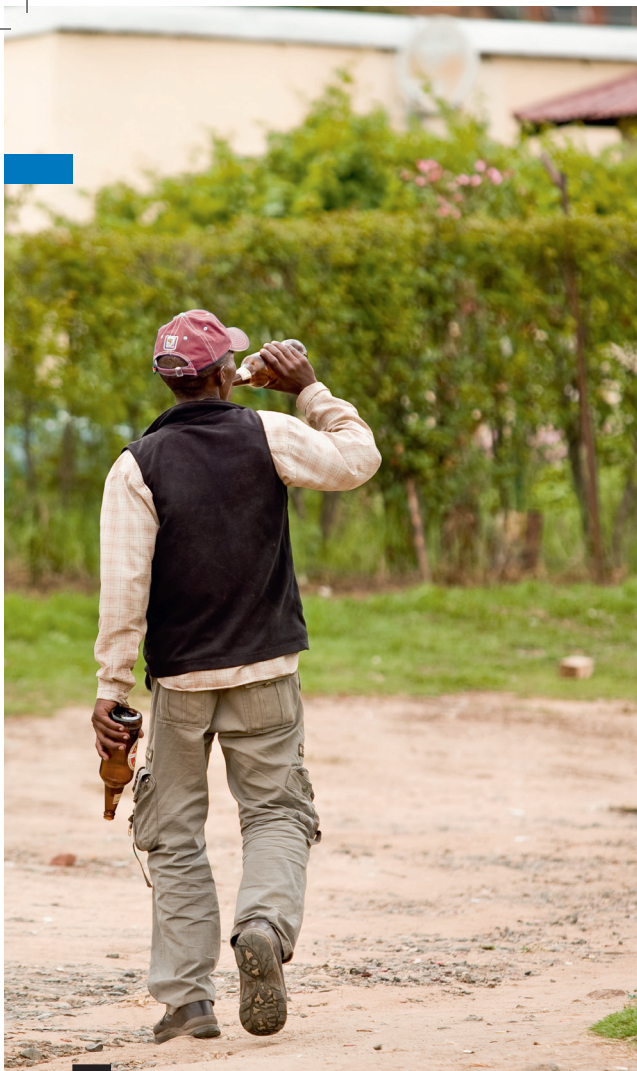
L'abus d'alcool est très répandu au Lesotho.