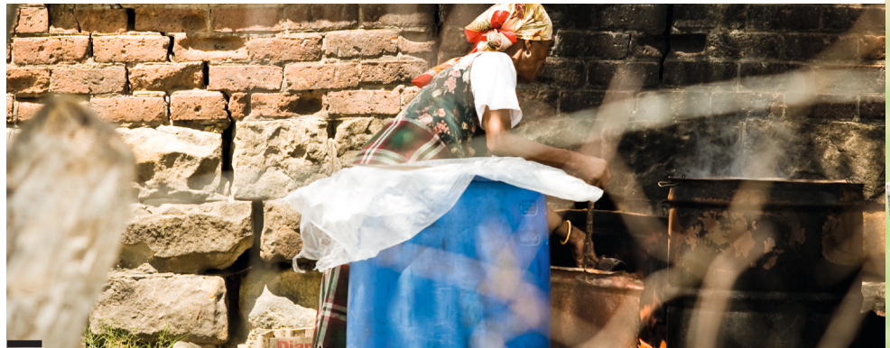
Production d'alcool à domicile, Lesotho.

«Nous sommes fiers d'annoncer que le Centre a intégré avec succès la méthode ICDP dans les programmes de traitement existants (lesquels incluent également la thérapie motivationnelle, le conseil individuel et la thérapie familiale) et dans les services de prévention. Bien sûr, nous devons encore surmonter quelques écueils, notamment