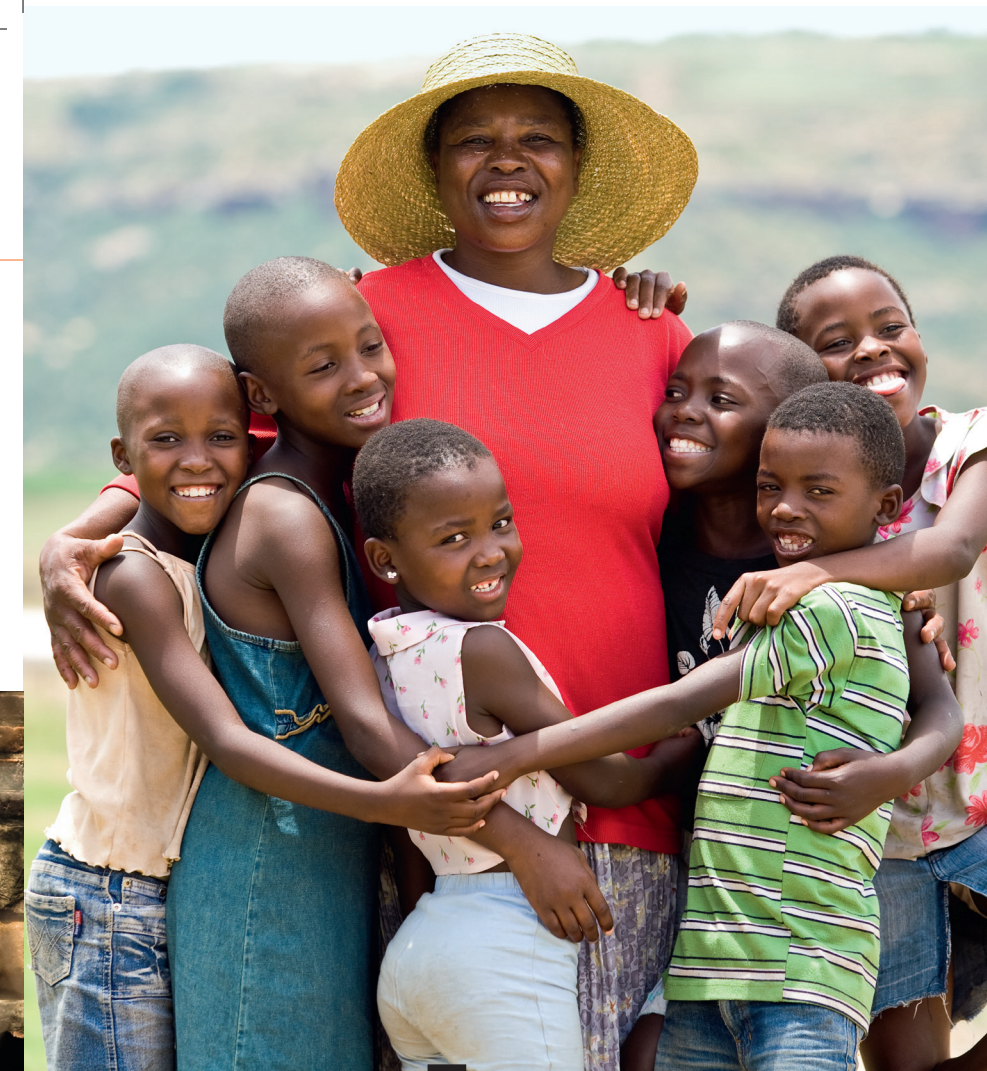
Croix-Bleue du Lesotho: prévention parmi les enfants.

ceux liés aux normes culturelles, et certaines convictions quant à l'éducation des enfants, mais nous croyons que la culture est dynamique, donc non immuable, et que grâce aux expériences positives, les méthodes ICDP trouveront une adhésion grandissante parmi nos populations.